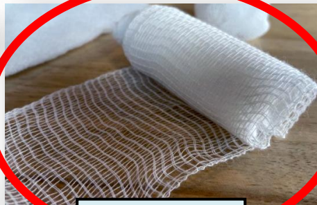
de la gaze