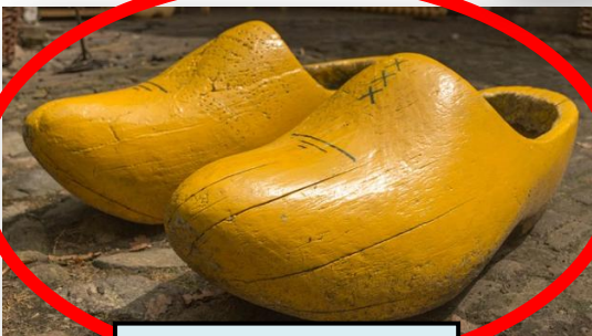
le sabot de bois