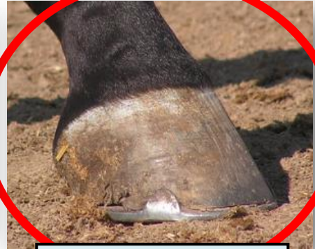
le sabot du cheval